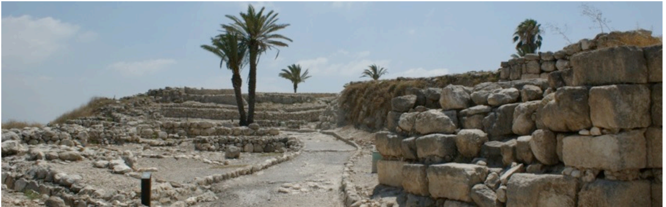
Ruines à Meguido