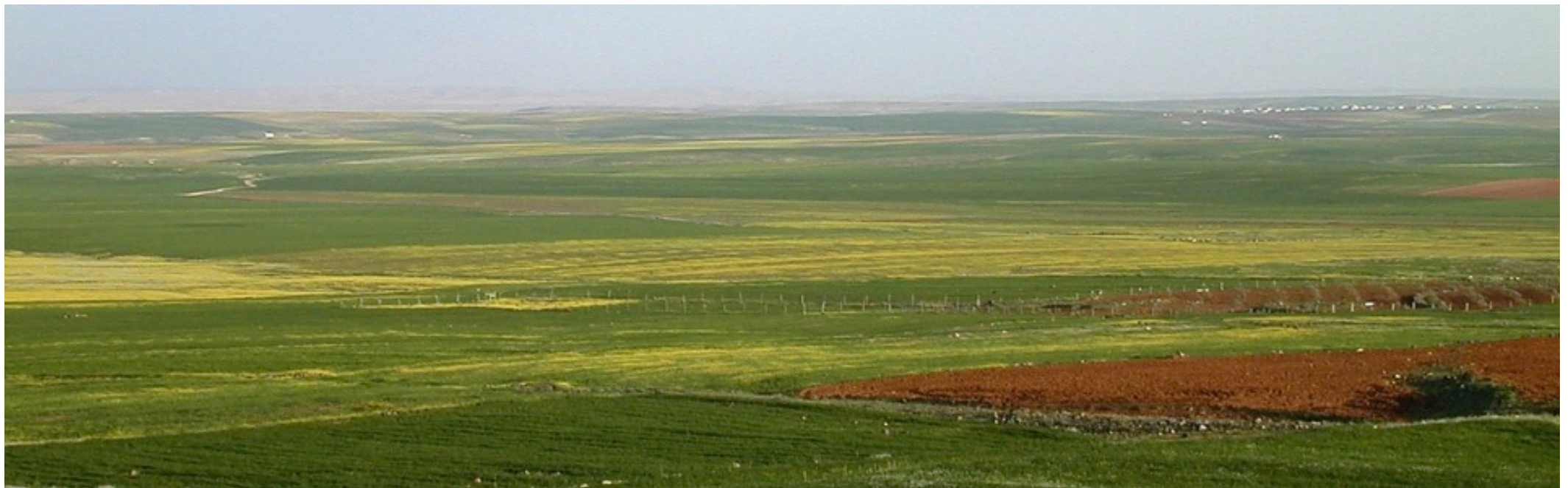
Champs de Moab

Elimélec meurt dans le pays de Moab. Sa femme Naomi reste dans le pays avec ses 2 fils. Ceux-ci se marient avec 2 Moabites: Orpa et Ruth. Environ 10 ans plus tard, les 2 fils meurent.